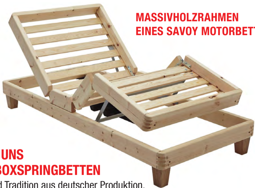
MASSIVHOLZRAHMEN EINES SAVOY MOTORBETTES

Aktion gültig bis 31.12.20 und nur für 180x200cm Betten.