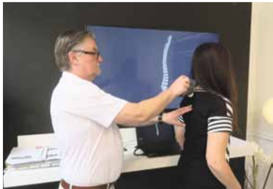
Wirbelscanner im Einsatz, strahlungsfrei und herstellerunabhängig zeigt er ein 3-D Bild Ihrer Wirbelsäule.

Wenn Schlafprobleme ein nächtlicher Dauerzustand für Sie sind, Ihre Muskeln häufig verspannen und Sie sich morgens wie gerädert fühlen, sind das typische Anzeichen dafür, dass Ihre derzeitige Matratze nicht die richtige für Sie ist. Auch die Entlastung der Muskulatur spielt dabei eine große Rolle. Ist diese verspannt, wirken enorme Druckkräfte auf die Bandscheiben.