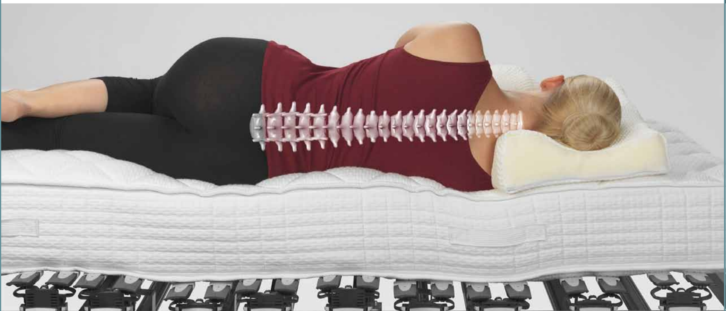
Das Mass sind Sie! – Perfekte Schlafposition!